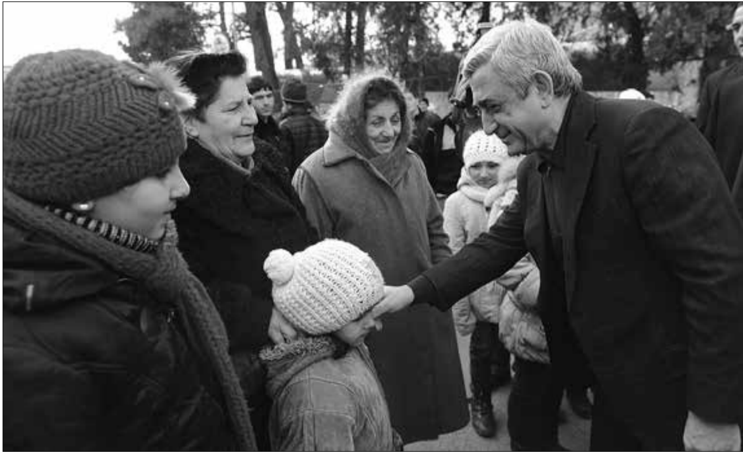
22 հունվարի 2013թ., Սյունիք

ՍԲ ԳՐԻԳՈՐ ՆԱՐԵԿԱՏԻ, ՄԱՏՅԱՆ ՈՐԲԵՐՈՒԹՅԱՆ, ԲԱՆ ԶԱ, Գ